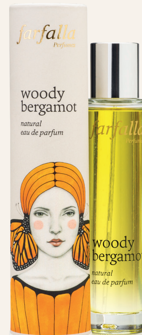
woody bergamot natural eau de parfum

Wo Du Deine Runden drehst, geht die Sonne auf. Leicht ist das Leben und mittendrin stehst Du. Mit ätherischen Ölen von Neroli, Mandarine, Tuberose, Zedernholz u. a., 50 ml