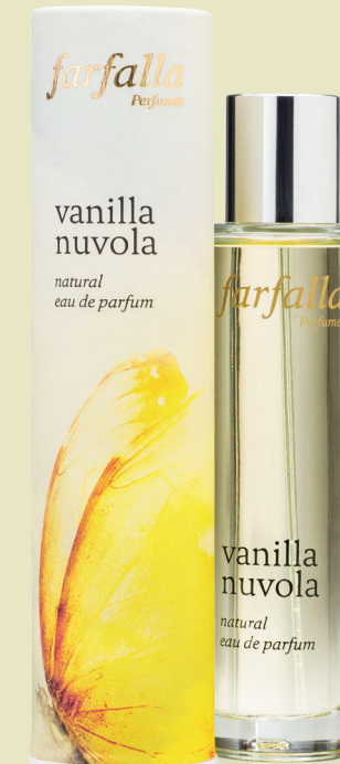
vanilla nuvola natural eau de parfum

Wo Du Deine Runden drehst, geht die Sonne auf. Leicht ist das Leben und mittendrin stehst Du. Mit ätherischen Ölen von Neroli, Mandarine, Tuberose, Zedernholz u. a., 50 ml