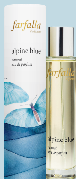
alpine blue new natural eau de parfum

Abenteuer beginnen, wo Pläne enden. Locket Dich die Neugier in unbekannte Welten? Die Lust auf Neues weckt den Nomaden in Dir. Mit ätherischen Ölen von Mandarine, Iris, Rosengeranie, Vetiver u. a., 50 ml