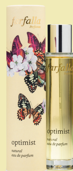
optimist natural eau de parfum

Ein kristallklarer Alpsee, blauglitzernd im Sonnenlicht. Ein Duft, der rein und hell ist wie die Luft der Berge, zart und unbeschwert. Mit ätherischen Ölen von Grapefruit, Zitrone, Balsamtanne, Arabischer Minze und Iris, 50 ml