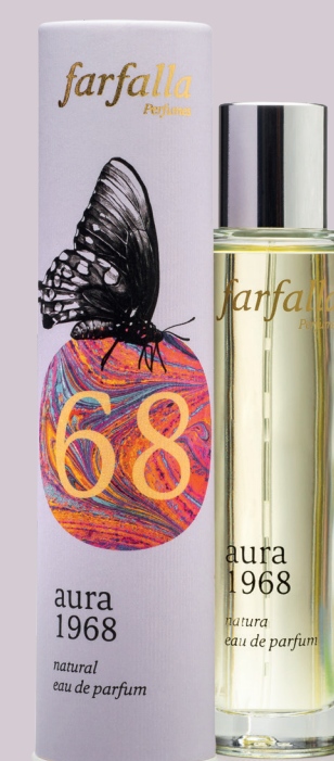
aura 1968 natural eau de parfum

Ein leichter Flügelschlag trägt Dich beschwingt davon. Wende dein Gesicht der Sonne zu, und lasse die Welt unter Dir. Mit ätherischen Ölen von Zitrone, Neroli, Pfefferminze, Melisse, Ingwer, Patchouli u. a., 50 ml