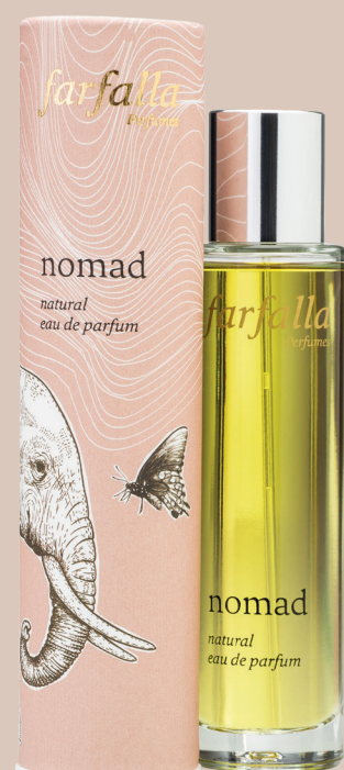
nomad natural eau de parfum

Einfach mal auf Wolke 7 schweben. Lass Dich tragen von sanfter Leichtigkeit und umhülle Dich mit Wohllullen. Mit ätherischen Ölen von Vanille, Ylang Ylang, Sandelholz u. a., 50 ml