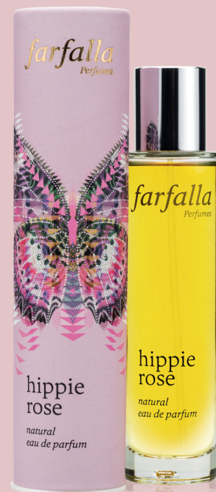
hippie rose natural eau de parfum

Gratulation, Sie haben sich für ein Naturprodukt entschieden! Ein natürliches Parfum ist wie ein gutes Live-Konzert – tiefgründig und mitreissend. Erleben Sie eine Parfumwelt, so wunderbar vielfältig und einzigartig, wie die Natur! Inspiriert von Aromen, Pflanzen und Begegnungen aus aller Welt, für Sie komponiert in der farfalla Duftmanufaktur.