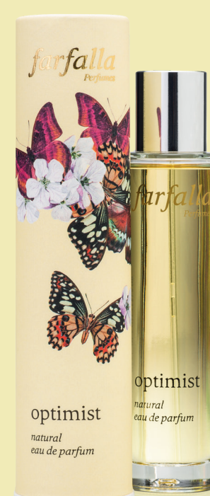
optimist natural eau de parfum

La limpidité d'un lac alpin, scintillant bleu sous le soleil. Un parfum pur et clair comme l'air des montagnes, doux et léger. Aux huiles essentielles de pamplemousse, citron, sapin baumier, menthe arabe et iris. 50 ml